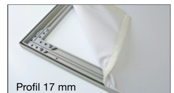
Profil 17 mm

Druckdaten werden vom Auftraggeber elektronisch zur Verfügung gestellt: als Vektorgrafik (Text in Pfaden) oder als Photoshopdatei (mit mind 300 dpi bei Maßstab 1:2)