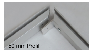
50 mm Profil